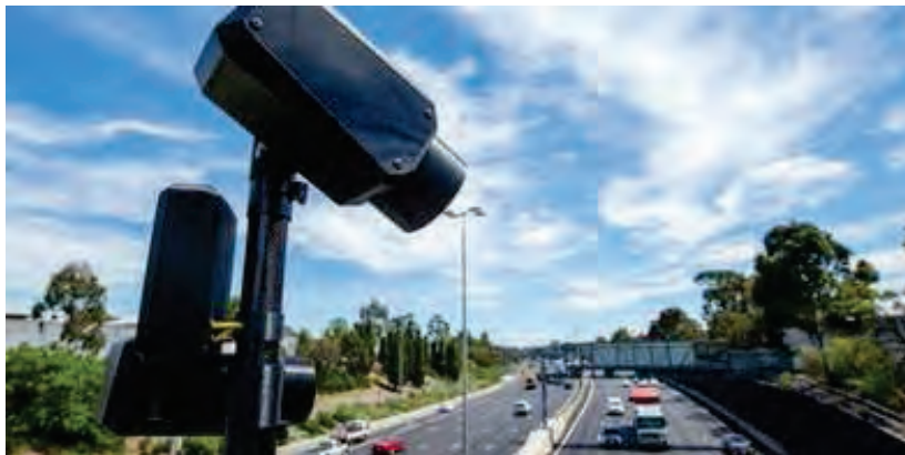
Slika 4. Kamere na portalima na autoputu

Podaci o svakom vozilu se sa mernih mesta (kamera) šalju na server najbliže naplatne stanice a odatle na Centralni nivo sistema. Obrada podataka na Centralnom nivou sistema se zasniva na uparivanju podataka sa ulaznih i izlaznih stanica čime se za svako vozilo formira TransakcijaVozila . Uparivanje podataka se radi po registarskoj oznaci vozila. Obrada podataka omogućava: