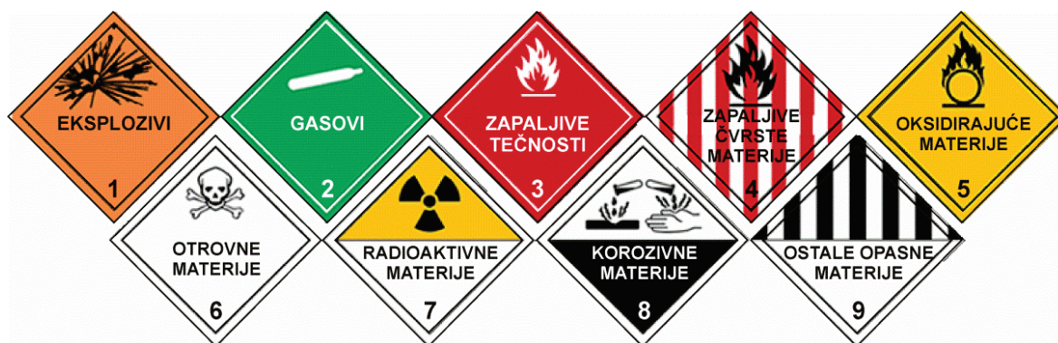
Slika 1. Klase opasne robe

Međunarodna zakonska regulativa za transport opasne robe obuhvata (slika 2):