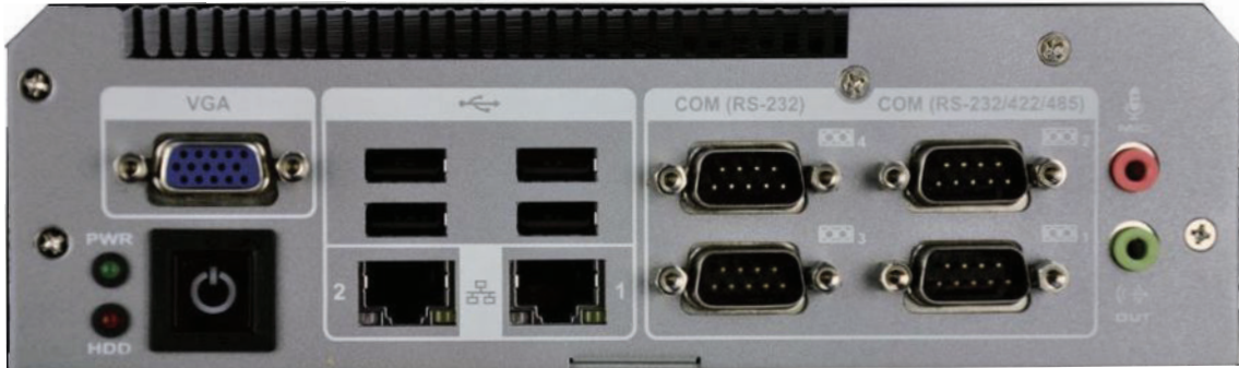
Izgled prednje strane