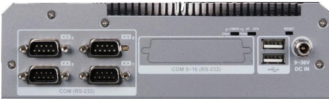
Izgled zadnje strane